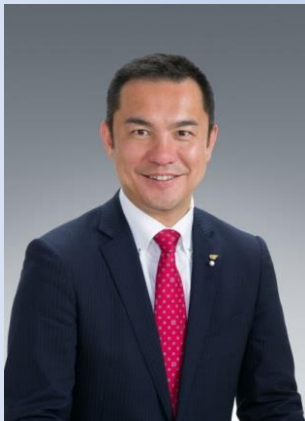
鈴木英敬 三重県知事