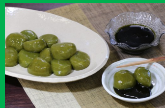
かぶせ白玉&みつがけ