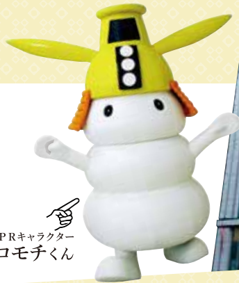
津市PRキャラクター シロモチくん