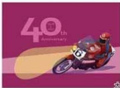
赤塚 deiv 治