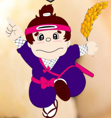
伊賀米イメージキャラクター：伊賀丸くん

米の食味ランキングにおいて「 特A 」の 最高評価 を 獲得した「 伊賀米コシヒカリ 」の 試食会 を開催いた します！炊飯器で炊くお米とは一味ちがったごはん をお楽しみください！