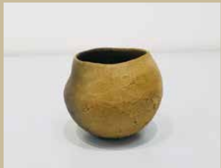
出展作品：鉢、盃、花入等