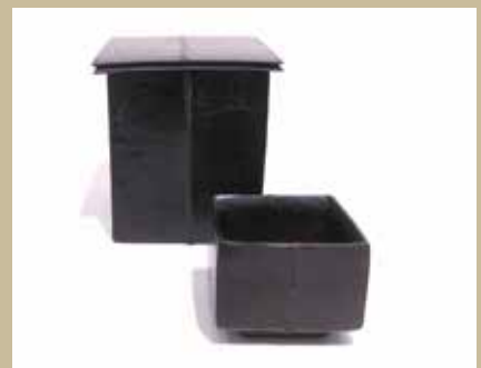
出展作品：皿、杯、菓子器等