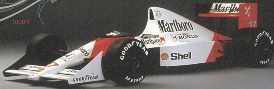
McLaren - Honda MP4/5B 1990年