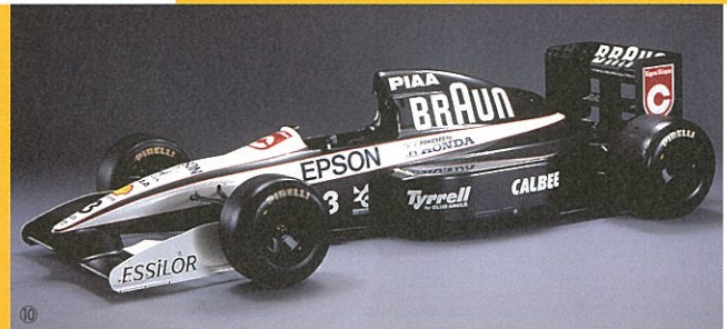
① Williams Honda FW10 1985年/② Honda RA107 2007年/③ BAR Honda 006 2004年/④ McLaren - Honda MP4 - 30 2015年/⑤ A.セナ ヘルメット(第1戦 USGP着用) 1990年/⑥ RA270 ステアリングホイール 1964年/⑦ Honda RC142 マン島レーサー 1959年/⑧ Honda RA166E Engine(FW11) 1986年/⑨ THE BENDIX TROPHY(BR)/MANUFACTURER'S TROPHY(BR) Presented to the winner of(BR)DETROIT GRAND PRIX VII 1988年/⑩ Tyrrell Honda 020 1991年 *展示資料は都合により変更する可能性があります。*展示専用車両も含まれます。