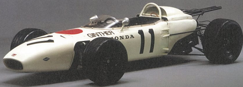
Honda RA272 1965年