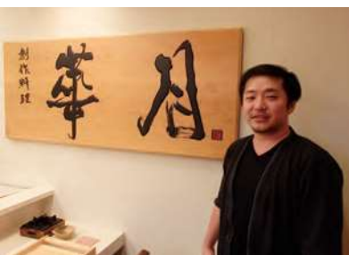
Uターン 熊野市「華月」