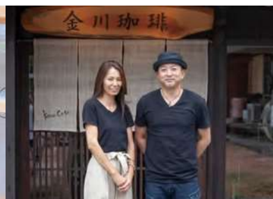
東京からIターン 多気町「金川珈琲店」